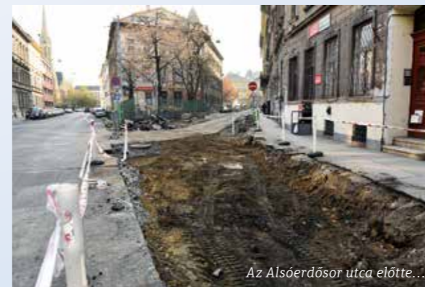
Az Alsóerdősor utca előtte...

Az Alsóerdősor utca Dohány utca–Izabella utca közötti szakaszának beépítési adottságaiból adódóan az utca jelentős hányadában a meglévő szabályozási szélesség miatt jellemzően helyben hagyó, de minőségi átépítés történt. Az Alsóerdősor utca Izabella utcával alkotott korábbi lapos