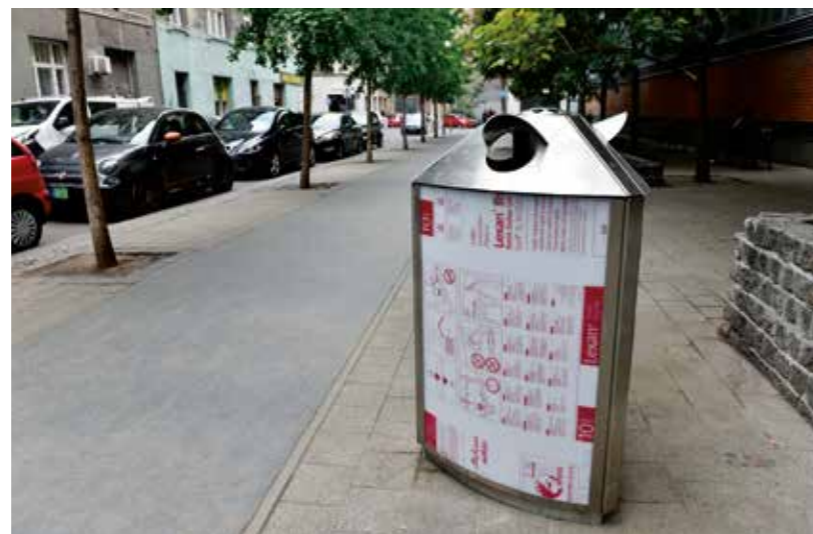
Az új, vandálbiztos kukáknak sokkal nagyobb az űrtartalmuk

A szemetesek kiválasztása során komoly kutatómunkát végeztek a döntéshozók azt illetően, hol, milyen típusú kukák váltak be leginkább. Így esett a választás erre a típusra, amely vastag, rozsdamentes acéllemezről készült, így az időjárással és az esetleges fizikai behatásokkal szemben is ellenálló. A szemetesek 3 bedobó nyílással rendelkeznek, melyek mindegyike egy-egy 49 liter űrtartalmú edényhez tartozik, a tetejükön hamuzó, csikktartó található. Erzsébetváros-szerte 68 új köztéri szemetest helyeztek ki, egyelőre a legnagyobb forgalmú szakaszokon (Király utca, Dob utca, Wesselényi utca, Dohány utca). Méretük miatt leginkább széles járdaszakaszokon és kereszteződésekben volt célszerű ezeket elhelyezni, így mindenki számára jól megközelíthetőek, észrevehetőek. Ürítésük Belső-Erzsébetvárosban naponta, a kerület többi részén pedig hétfő, szerda és pénteki napokon történik. Az eddig beszerzett és kihelyezett kukák mind kiállták a próbát, rongálás nem fordult elő. A zárt gyűjtőtérnek köszönhetően a szemetet nem fújja ki belőlük a szél, méretük miatt pedig az ürítést végző cég munkatársai nem találkoztak túlméretű kukákkal.