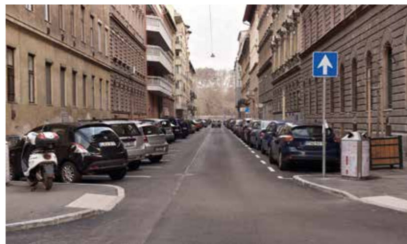
Az újonnan felújított utcákba is már ezeket a szemeteseket helyezik ki

Cím: 1078 Budapest, Nefelejcs utca 39. Tel.: 06 (30) 533-7446