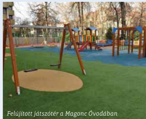
Felújított játszótér a Magonc Óvodában

Várhatóan március végén elkezdődik a használaton kívül álló Damjanich utca 4. szám alatti ingatlan felújítása. Az épület egyik szárnyát a Molnár Antal Zeneiskola számára alakítják ki. Hangszigetelt, a kor követelményeinek megfelelő oktatóterem és egy 70 főt befogadni képes hangversenyterem