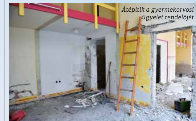
Átépitik a gyermekorvosi ügyeleti rendelőjét

A Vörösmarty utca 14. szám alatt található gyermekorvosi rendelő modernizációját a tőle egy sarokra található felnőtt háziorvosi ügyelet felújításának befejezését követően